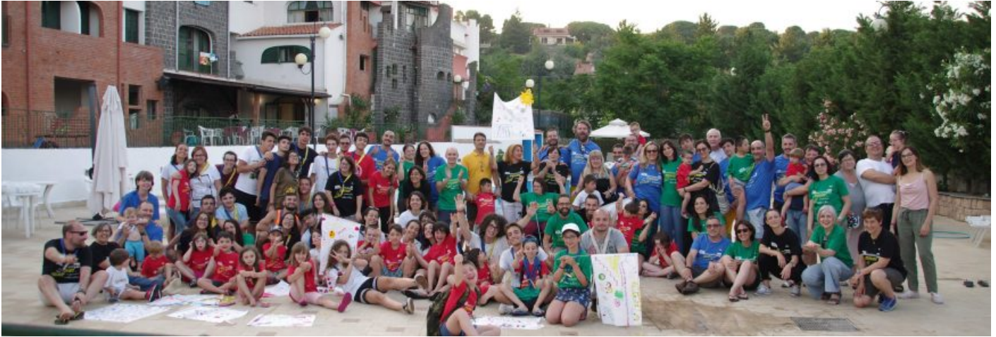
La meravigliosa famiglia di Vita21