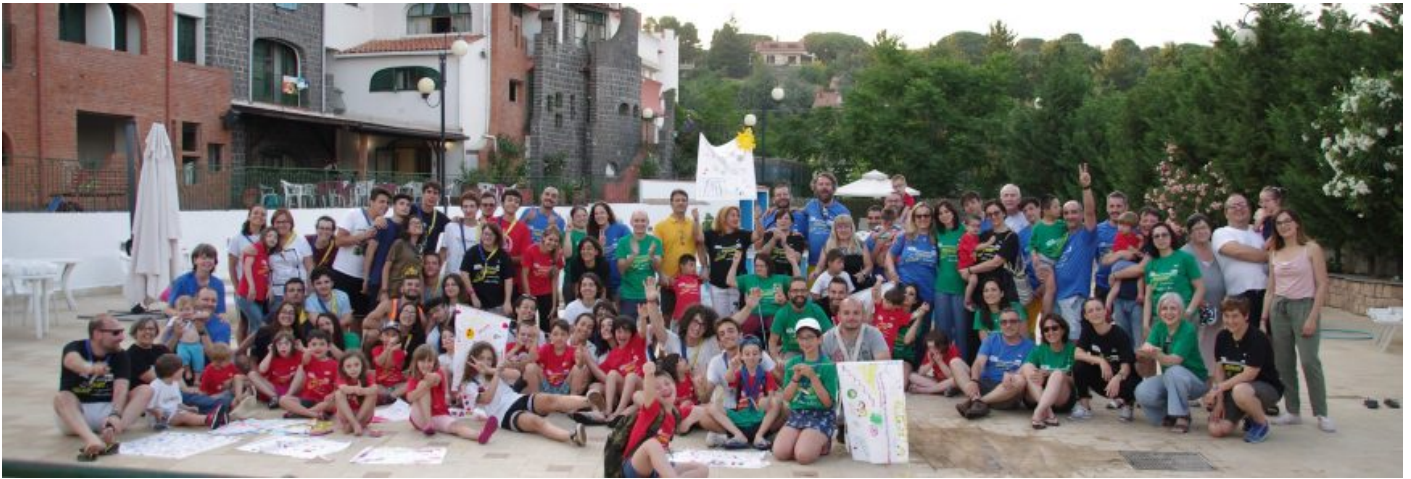
La meravigliosa famiglia di Vita21