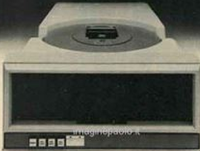
5400-12 Top Load Drive

* Factory rebuild 10MB cartridge disk drive only