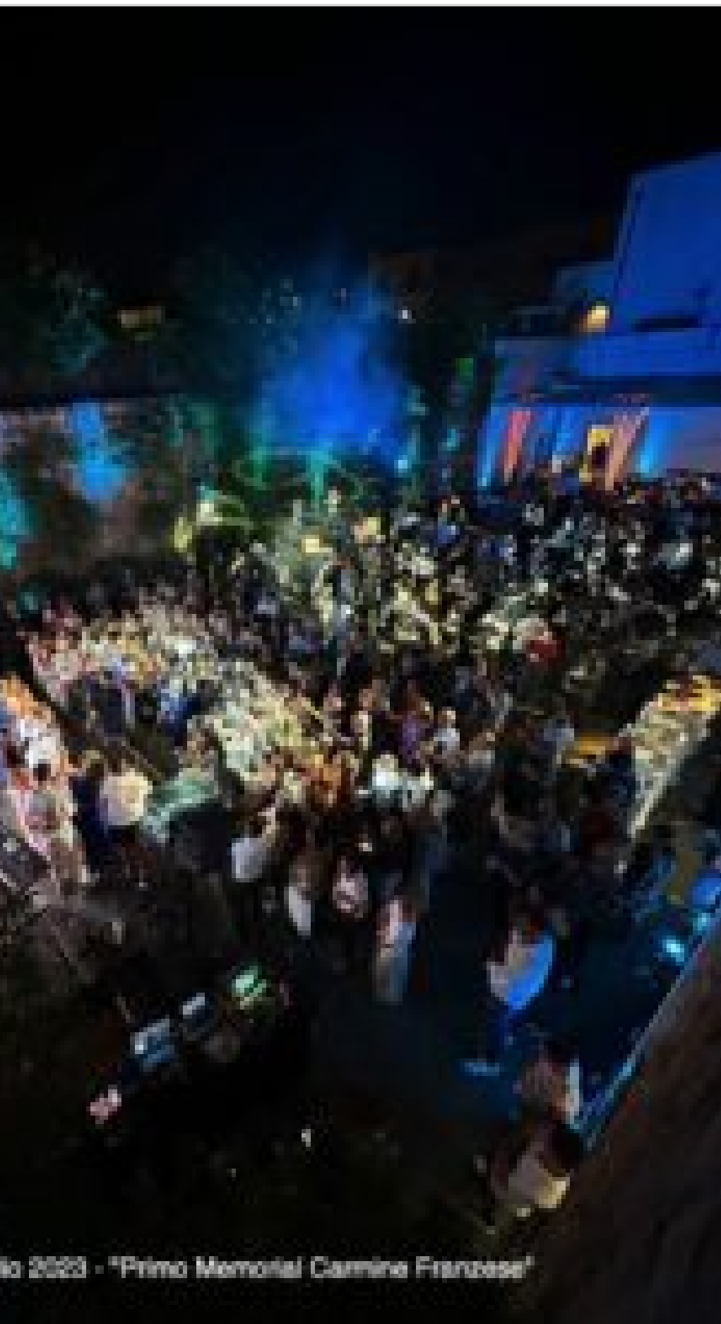
10 2023 - "Primo Memorial Carmine Franzese"