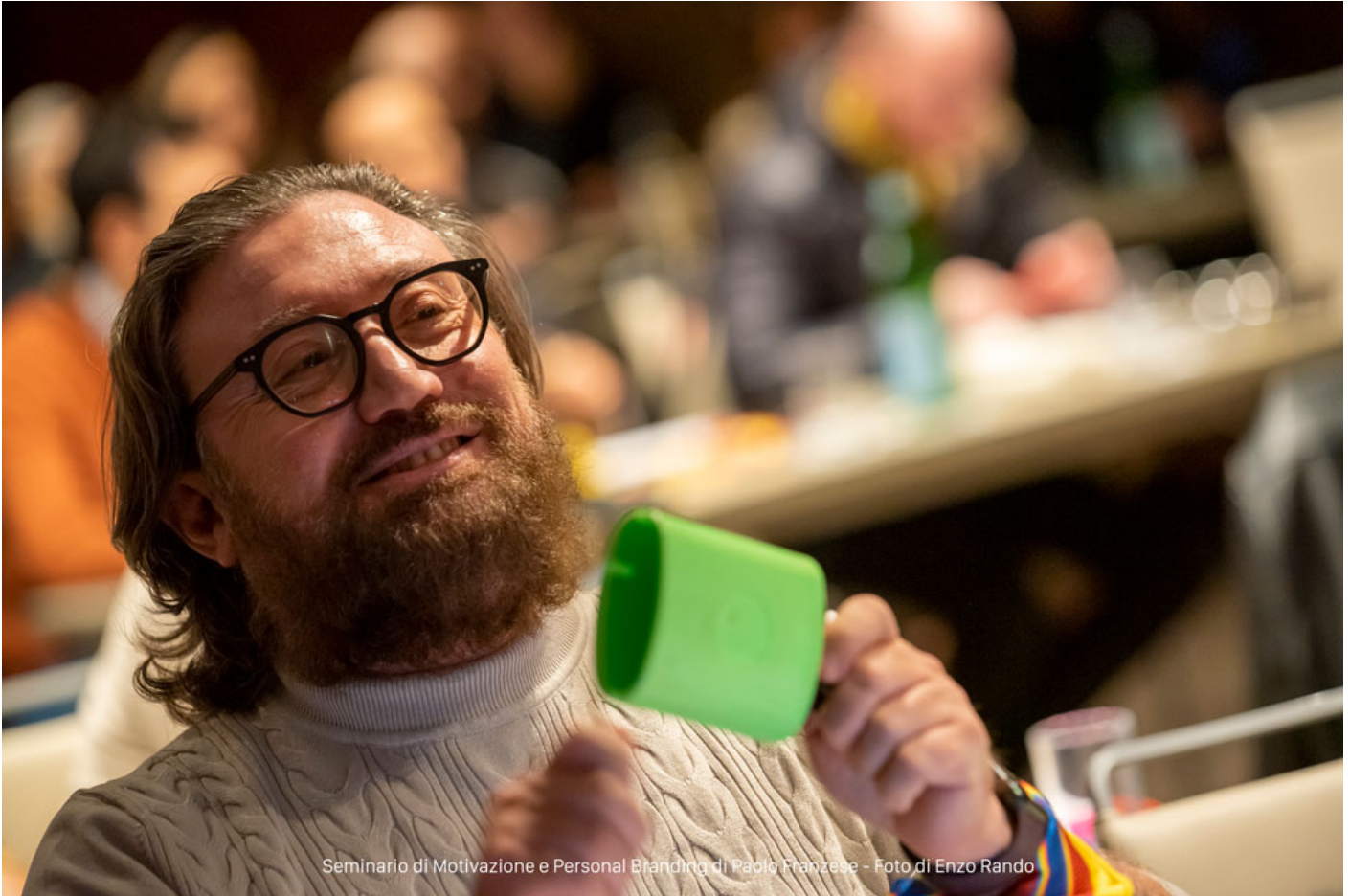
Seminario di Motivazione e Personal Branding di Paolo Franzese

Paolo Aveta: Developer specializzato prettamente in videogiochi.