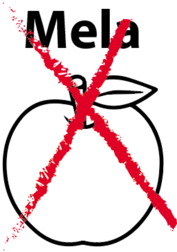
Non fare questo