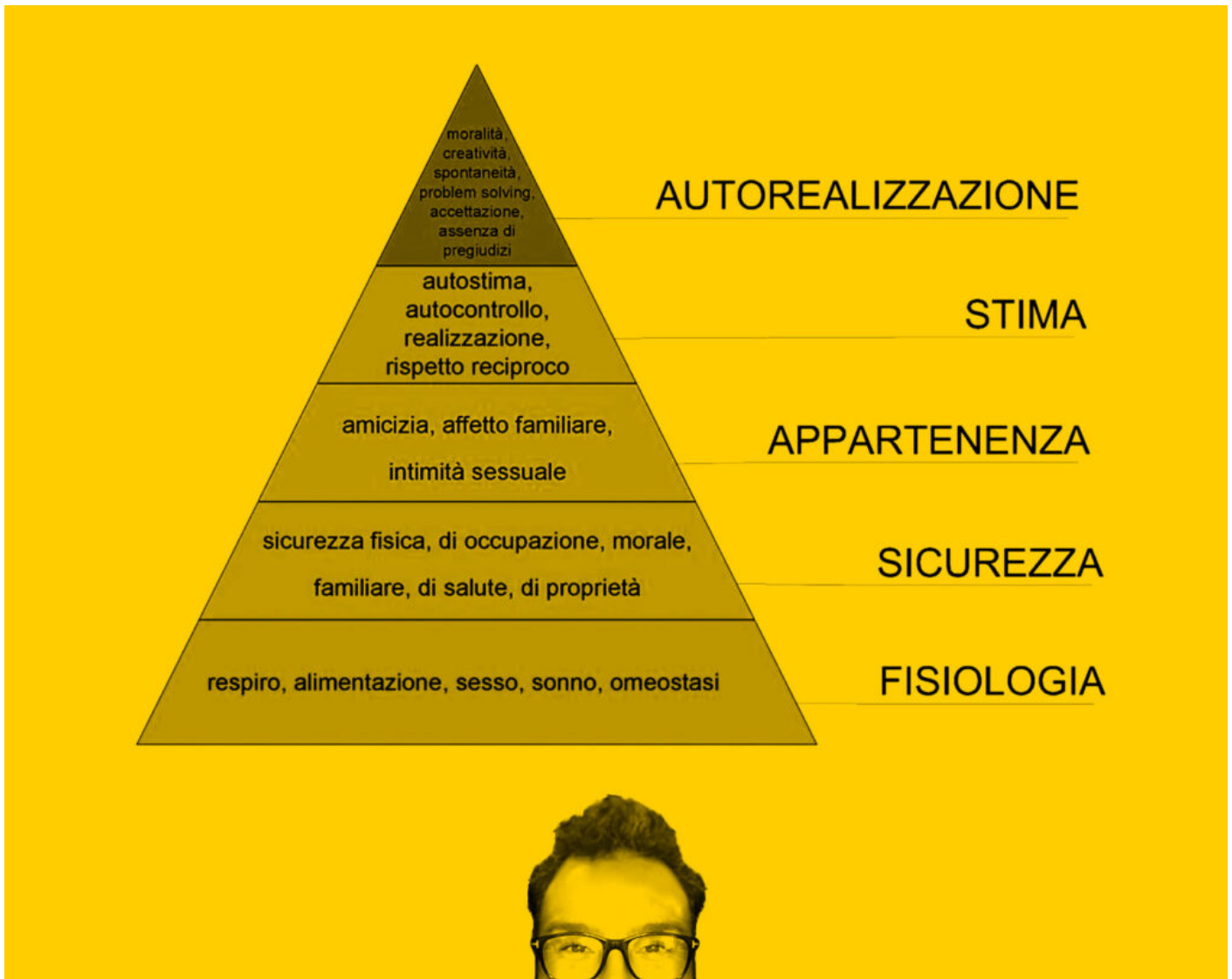
La piramide dei bisogni di Abraham Maslow 1954

Questi bisogni possono indicarci la strada per capire come possiamo aiutare il prossimo. Come appagare i bisogni, questo il nostro dovere, questo ha a che fare con il marketing .