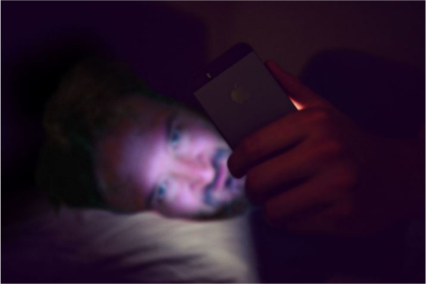
Immagine tristissima... No?

Circa più di due miliardi di persone in tutto mondo usano quotidianamente gli smartphone, per una media di cinque ore al giorno, e siamo davanti ad uno spaventoso aumento dell'utilizzo dello smartphone prima di addormentarsi, specialmente nelle prossime generazioni (gen Z) .