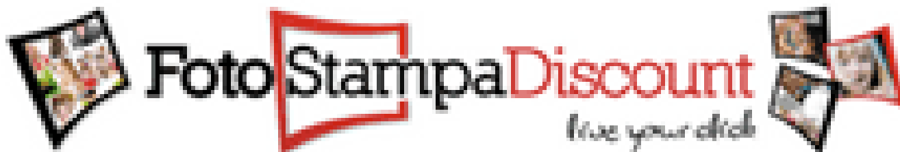
Foto Stampa Discount

Fotostampadiscout è una azienda italiana che crea dalle tue foto calamite di diverse forme, stampate su uno speciale foglio magnetico A4 e ritagliate in forme differenti. Una simpatica idea per personalizzare un cadeau, una bomboniera, per pubblicizzare la propria attività, o semplicemente per tappezzare il vostro frigo con i ricordi più belli.